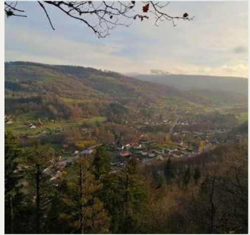
Blick auf das Dorf Ménénil

“Der Grande Roche und der Heuchau-Wasserfall ermöglichen es Ihnen, die ganze Vielfalt der Vogesenlandschaft auf kurzer Distanz zu genießen. Ein Spaziergang für Liebhaber unberührter Natur, die frische Luft schnappen möchten.”