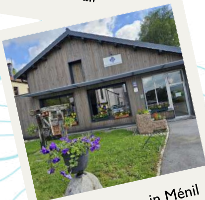
Tourismusbüro in Ménil