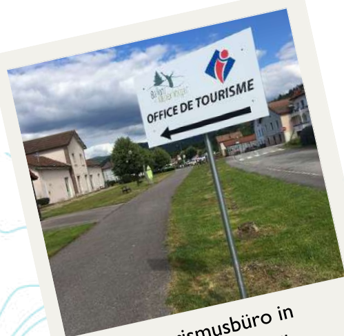
Tourismusbüro in Rupt-sur-Moselle