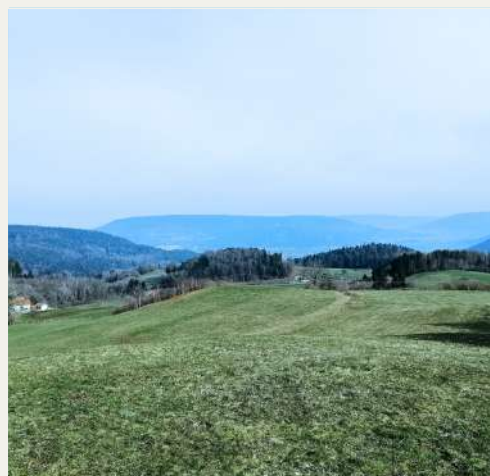
Blick auf die Region Remiremont vom Gipfel des Beuille

“Diese kurze Wanderung ist ideal, um die Höhen von Rupt-sur-Moselle zu erkunden, nur einen Steinwurf vom Plateau des Mille Étangs und der grünen Region Remiremont entfernt, die vom Massif du Fossard dominiert wird”.